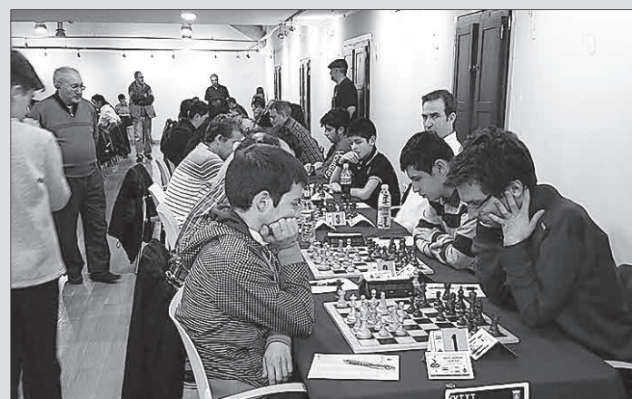
Imagen de una de las partidas celebradas durante el Abierto de Alfaro.