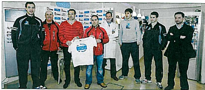
Ópticas Caro Cánovas y el Centro Titín III organizan esta competición.

Los partidos en categoría prebenjamín, de 4 a 6 años (9 pelotaris inscritos), se jugarán con pelota blanda, a dos jocos de ocho tantos (si fuera necesario un tercero, éste sería a cinco); y de seis a ocho años